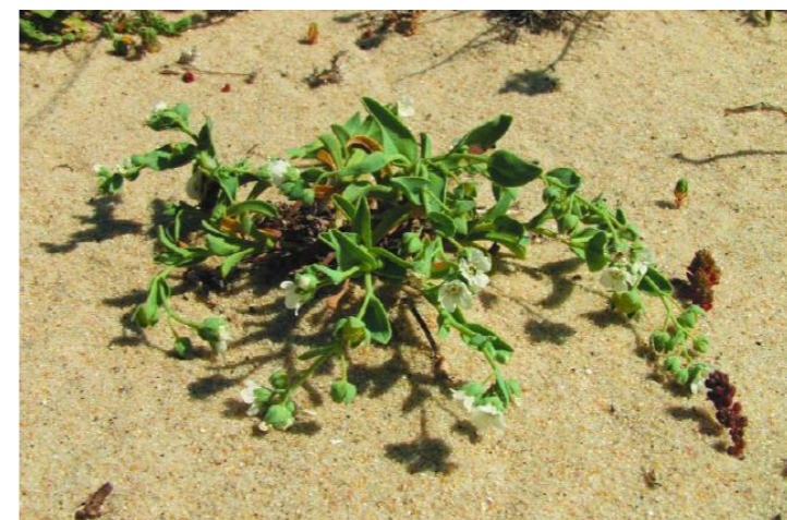
Omphalodes littoralis subsp. Gallaecica