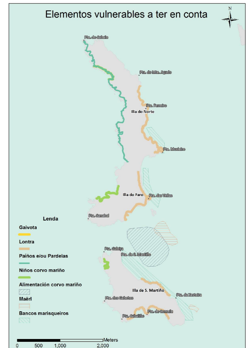
Mapa 2 Elementos vulnerables destacados