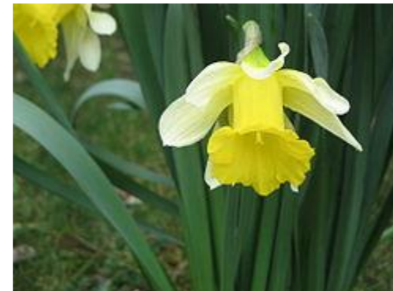
Narcissus pseudonarcissus subsp. nobilis