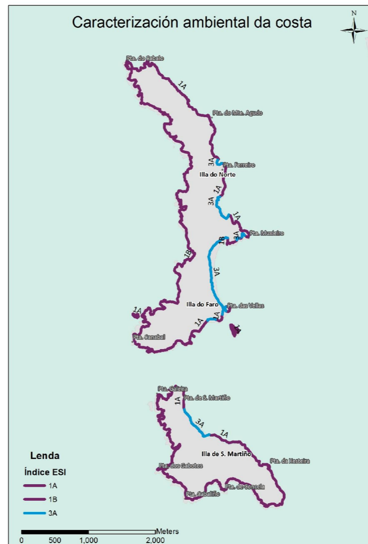
Mapa 1 Caracterización ambiental da costa de Cíes